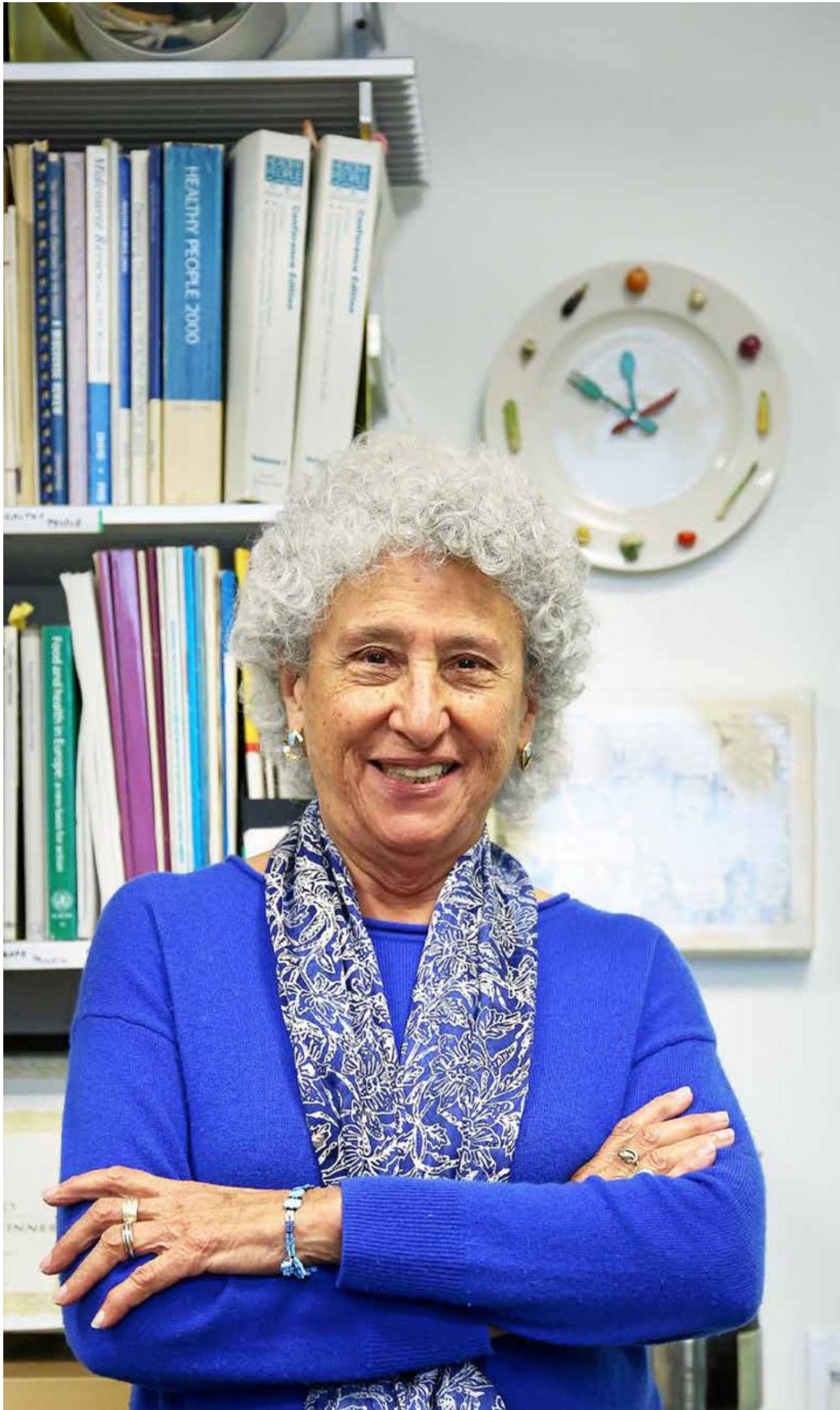
Vaktbikkje: Matprofessor Marion Nestle har vært tidlig på barrikadene i mange av de største mat- og landbrukspolitiske slagene de siste tiårene. Nå tar hun sikte på et nytt slag.